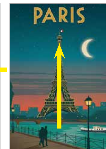
Composition axiale, verticale

Objectif : Reconnaître les principes de composition utilisés