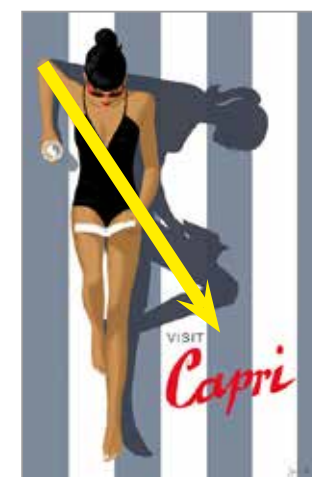
Composition en diagonale et rythme de motifs verticaux