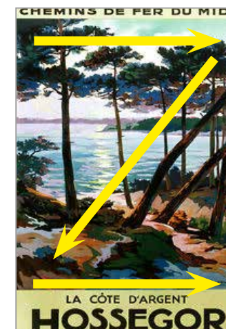
Composition en Z