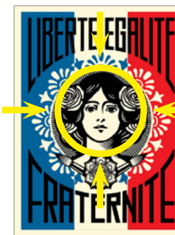
Composition symétrique et centrée