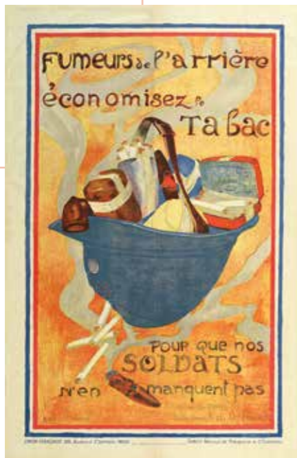
“Fumeurs de l'arrière économisez le tabac pour que nos soldats n'en manquent pas” Ecoliers de Paris. Ville de Paris, 1918, 55 x 36 cm AD 40, 6 AFFI 253

Au début de 1918, le Ministre de l'Education Nationale eut l'idée d'organiser un concours entre les élèves de 11 à 16 ans pour la création d'affichettes.