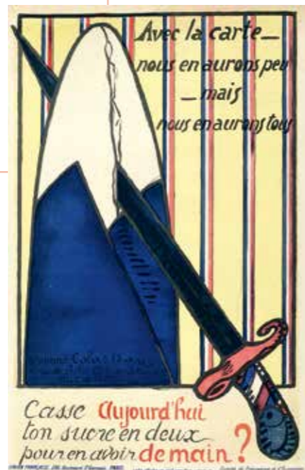
“Casse aujourd'hui ton sucre en deux pour en avoir demain” Ecoliers de Paris. Ville de Paris, 1918, 53 x 34 cm AD 40, entrée 2663