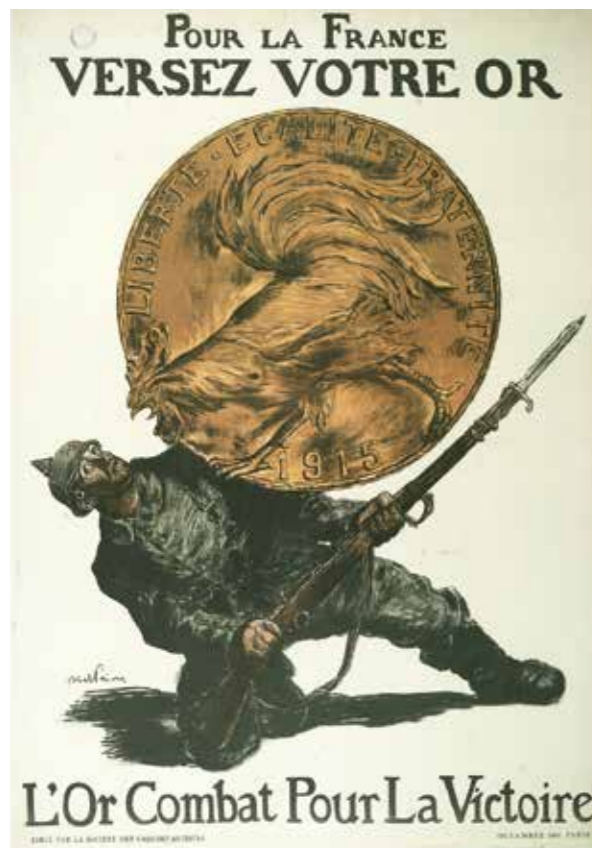
“Pour la France versez votre or. L'or combat pour la Victoire” Abel Faivre. Paris, Devambez, 1915, 112,5 x 78 cm AD 40, 2 AFFI 8