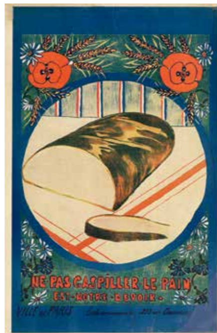
“Ne pas gaspiller le pain est notre devoir” Ecoliers de Paris. Ville de Paris, 1918, 52 x 34 cm AD 40, entrée 2663

a) Observe et lis les trois affiches pour répondre aux questions suivantes :