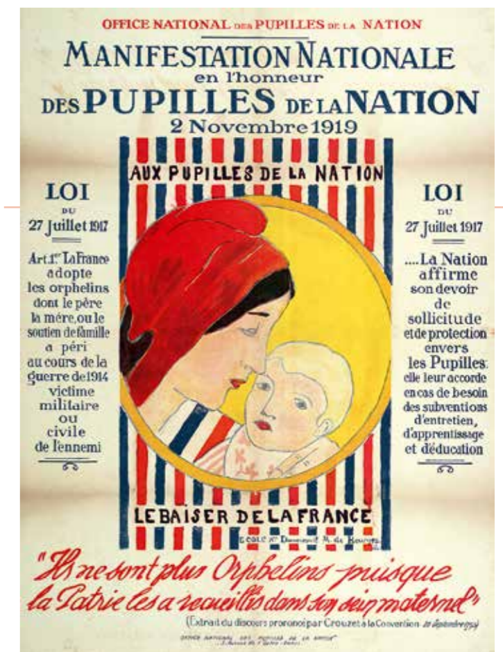
"Manifestation nationale en l'honneur des Pupilles de la Nation" Office National des pupilles de la nation. Paris, 1919, 76,5 x 56 cm AD 40, entrée 2663