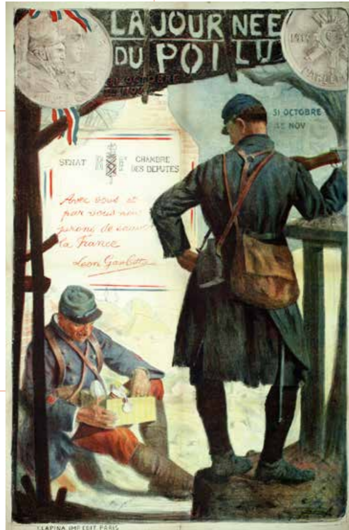
"La Journée du poilu. 31 octobre - 1 er novembre" Jonas. Paris, Lapina, (1914), 120,5 x 80 cm - AD 40, entrée 2663

Décris l'uniforme des soldats en entourant les éléments qui sont sur l'affiche (aide-toi du mannequin du soldat de 1914) :