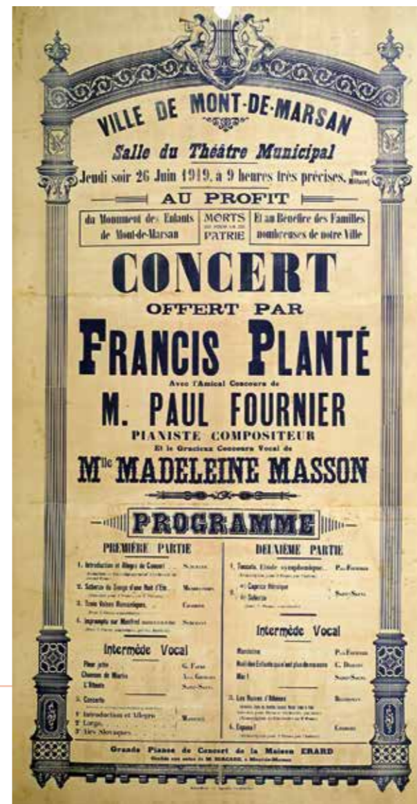
“Concert offert par Francis Planté, le 26 juin 1919 à la salle du théâtre municipal à Mont-de-Marsan, au profit du monument des enfants de Mont-de-Marsan, morts pour la Patrie et au bénéfice des familles nombreuses de notre ville”. Mont-de-Marsan, Dupeyron, 180 x 86 cm - AD 40, 68 J 59

Observe l'affiche et réponds aux questions ci-dessous :