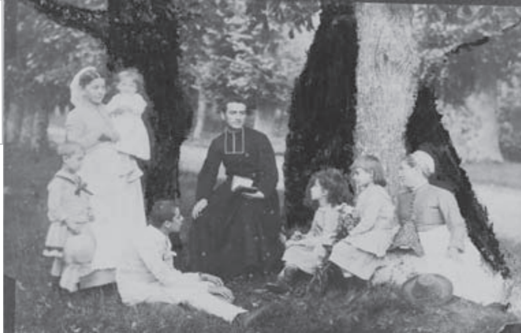
Photographie des cinq enfants de Francis Planté avec leurs bonnes d'enfants et leur précepteur, circa 1886.