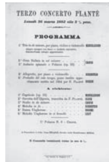
Programme présentant le troisième concert donné par Francis Planté dans la nouvelle salle du Conservatoire, à Milan, le 26 mars 1883. AD 40, 68 J 61, dépôt du PNRLG.