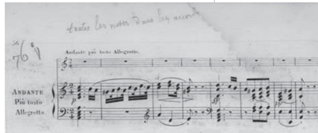
Extrait de "Vingt-quatre préludes dans les tons mineurs et majeurs pour le piano forte" par J. N. Hummel, Maurice Schlesinger éditeur, volume avec la couverture personnalisée "Francis, élève de Mme de St-Aubert", 1846.