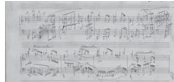
Transcription par Francis Planté de l'"Ouverture d'Obéron" de Weber, Mont-de-Marsan, mars 1868. AD 40, 68 J 51, dépôt du PNRLG.