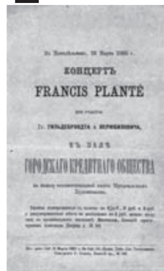
Affiche annonçant le concert de Francis Planté [avec la participation de mesdames ou messieurs Guildebrant(a) et Vierjbilovitch(a)] à la salle de la société du crédit municipal en Russie au bénéfice de la caisse de bienfaisance des musiciens et des peintres, le 28 mars 1883. AD 40, 68 J 61, dépôt du PNRLG.

3 OBSERVE LES TROIS PROGRAMMES CI-DESSOUS