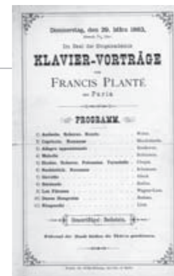
Concert de piano par Francis Planté dans la salle de l'académie de chanson à Berlin, 1p. papier, le 29 mars 1883. AD 40, 68 J 61, dépôt du PNRLG.