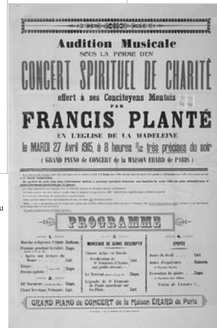
Affiche du premier concert du retour à la scène de Francis Planté, après un retrait de sept ans à cause de la guerre, Mont-de-Marsan, 27 avril 1915. AD 40, 68 J 59, 62, dépôt du PNRLG.

Le fabricant de piano est un facteur de piano.