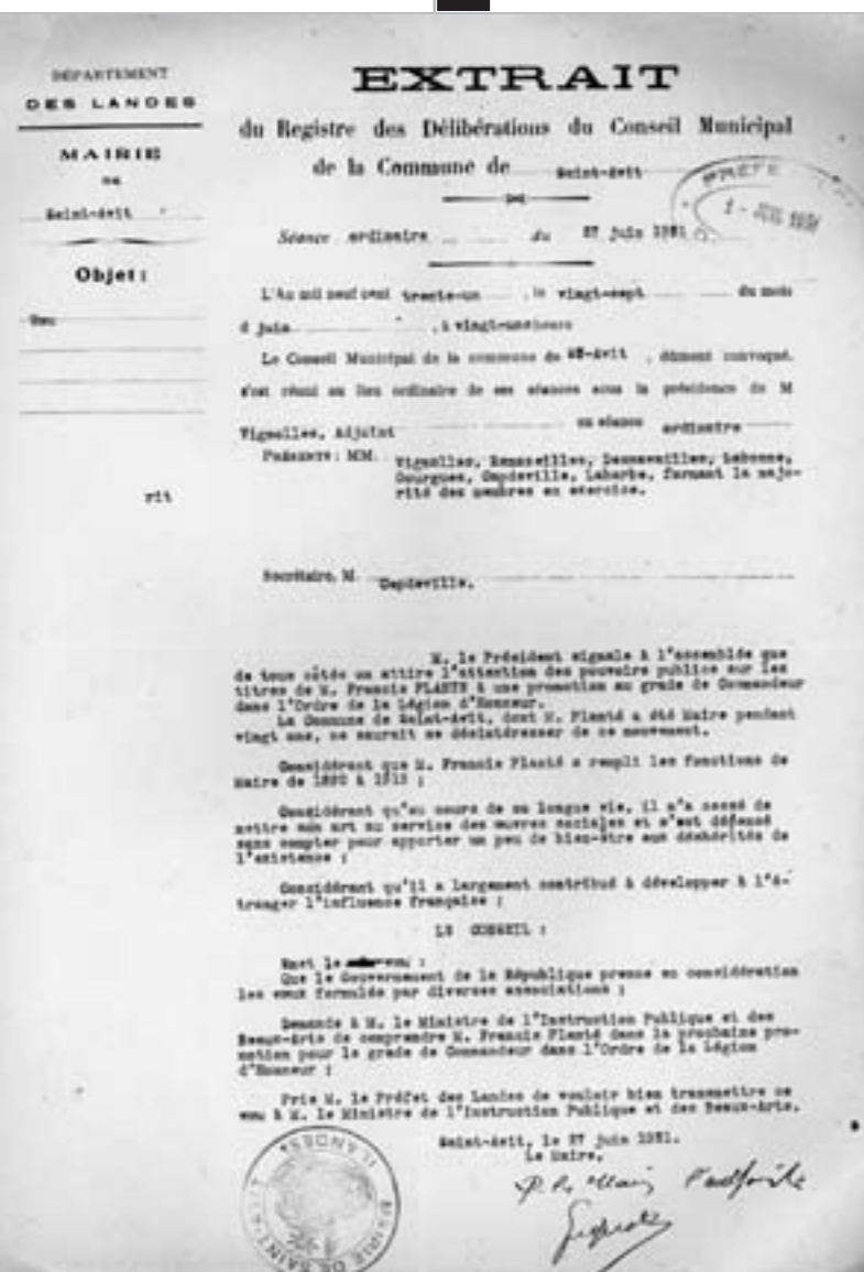
Extrait du registre de délibérations de la commune de Saint-Avit, le 27 juin 1931. AD 40, 1M 397, dépôt du PNRLG

1 - Quelle est la nature de ce document ?