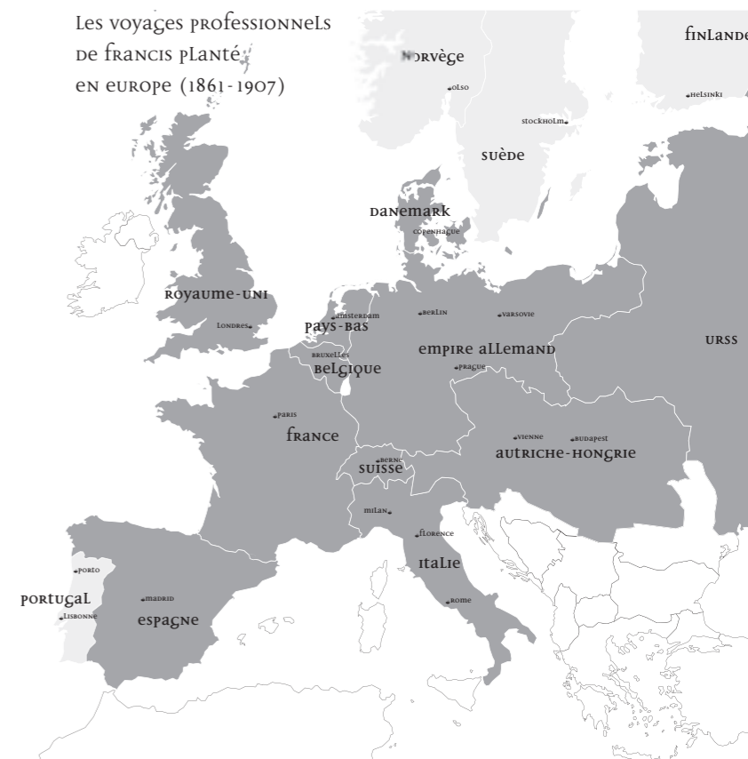
Carte de l'Europe fin XIX e - début XX e siècle

Les voyages professionnels de Francis Planté en Europe (1861-1907)