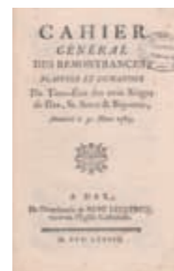
AD 40, III B 8