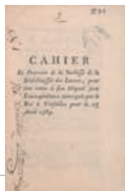
AD 40, III B 8