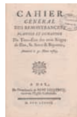
AD 40, III B 8